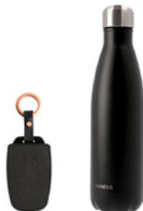
선택 A 키커버 & O링 스트랩 & 워터보틀

※ 기프트 상품은 제조사의 여건이나 당사 사정에 의해 품목 및 디자인이 변경될 수 있습니다.