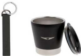
선택 C 가죽키링 & 인슐레이트 컵 ※ 가죽키링은 화이트 / 베이지 / 네이비 / 블랙 중 색상 선택이 가능합니다.