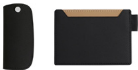
선택 B 스윙키커버 & 카드지갑 ※ 스윙키커버와 카드지갑은 화이트 / 베이지 / 블랙 중 색상 선택이 가능합니다.