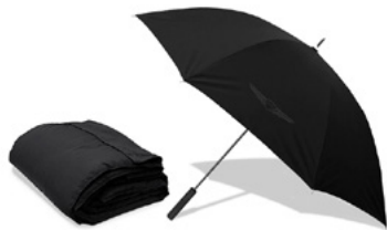
선택 A 구스 담요, 폴카본 미들우산

※ 기프트 상품은 제조사의 여건이나 당사 사정에 의해 품목 및 디자인이 변경될 수 있습니다.