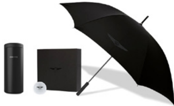
선택 B 텀블러, 골프공 9구, 폴카본 장우산