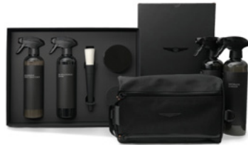
선택 C 카케어 SET 구성품 : 카나우바 하드왁스, 가죽세정제, 가죽보호제, 유리세정제, 벨레제거제, 활철분제거제, 철분제거제, 워터리스 간편세차, 디테일링 붓 2종, 파우치