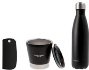
선택 A 스윙키커버 & 인슐레이트 컵 & 워터보틀

※ 기프트 상품은 제조사의 여건이나 당사 사정에 의해 품목 및 디자인이 변경될 수 있습니다.