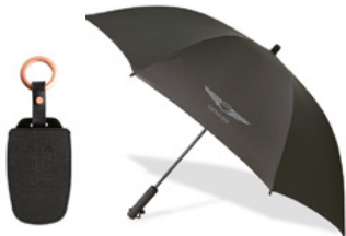
선택 C 키커버 & O링 스트랩 & 경량 미들우산