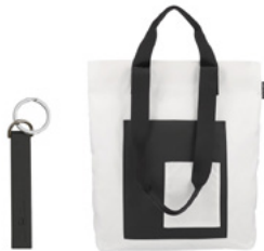
선택 B 가죽키링 & 에어백 에코백 ※ 가죽키링은 화이트 / 베이지 / 네이비 / 블랙 중 색상 선택이 가능합니다.